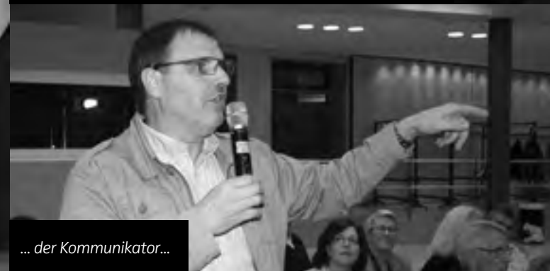
... der Kommunikator...

... tung soll, was wir unseren Lesern berichten wollen. Das „Wie“ aber, hast Du ohne «wenn und aber» mir überlassen. Du hast Dich um erforderliches Text- und Bildmaterial gekümmert, mir zugänglich gemacht oder geliefert. Zu den Arbeitssitzungen brachtest Du immer gute Laune mit. Auch wenn uns die Themen manchmal noch so trocken vorkamen, wir konnten ihnen beim redaktionellen Abarbeiten meistens Lacher abgewinnen. So gesehen waren Redaktions-Sitzungen für mich meist ziemlich vergnüglich.