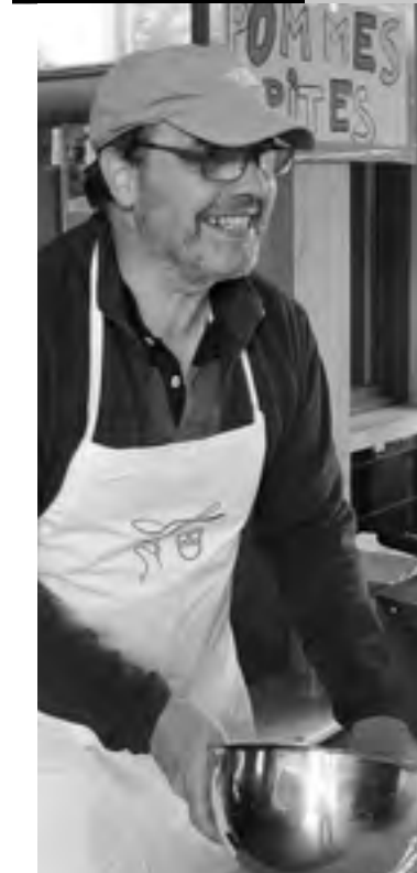
... der Motivator...