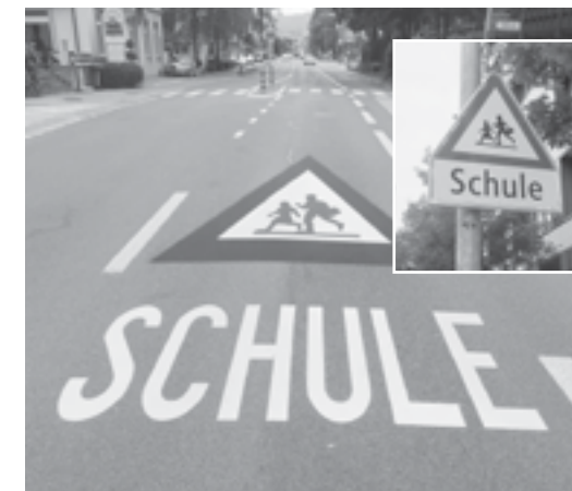
Gut sichtbare Strassenmarkierung plus Achtung-Tafel rechts der Strasse.