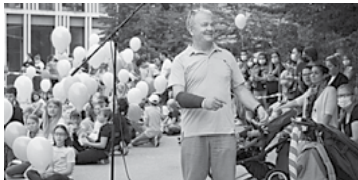
...wenn auch oft nur im Spiel.

Zur grossen Herausforderung und auch Ärgernis der letzten fünf Jahre gehört die ganzheitliche Schulraumplanung. Nebst fehlenden Schulräumen hat es auch für den Mittagstisch und die Nachmittagsbetreuung zu wenig Plätze. Weiter kommt die fehlende Sporthalle hinzu. In diesem Bereich scheint die politische Seite der Stadt Zug in einem Dornröschenschlaf zu stecken, wurde von der Schulseite doch schon früh auf diese Herausforderungen und kommenden Engpässe hingewiesen. Im letzten halben Jahr ist nun Bewegung in die Lösung der anstehenden Raumprobleme gekommen und ich hoffe sehr, dass dies nicht zu spät ist und nicht jahrelang Provisorienbauten die Notsituation überbrücken müssen.