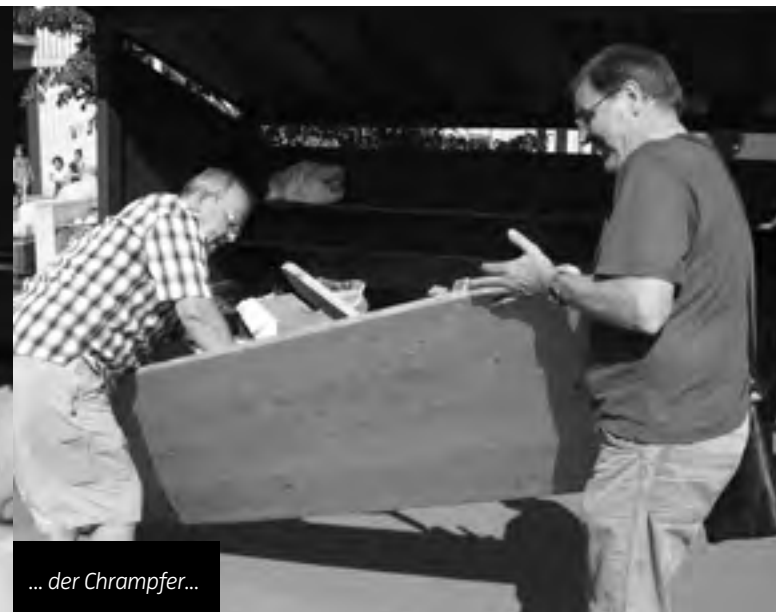
... der Chrapfner...