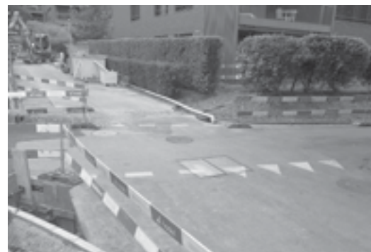
Neue Vortrittsregelung Bleichmattweg / Bleichstrasse (Zurzeit Baustelle).

„Die Bevorzugung des Bleichmattwegs ist keine temporäre Massnahme, sondern die im Text des Flyers erwähnte Aufwertung der Veloroute.“