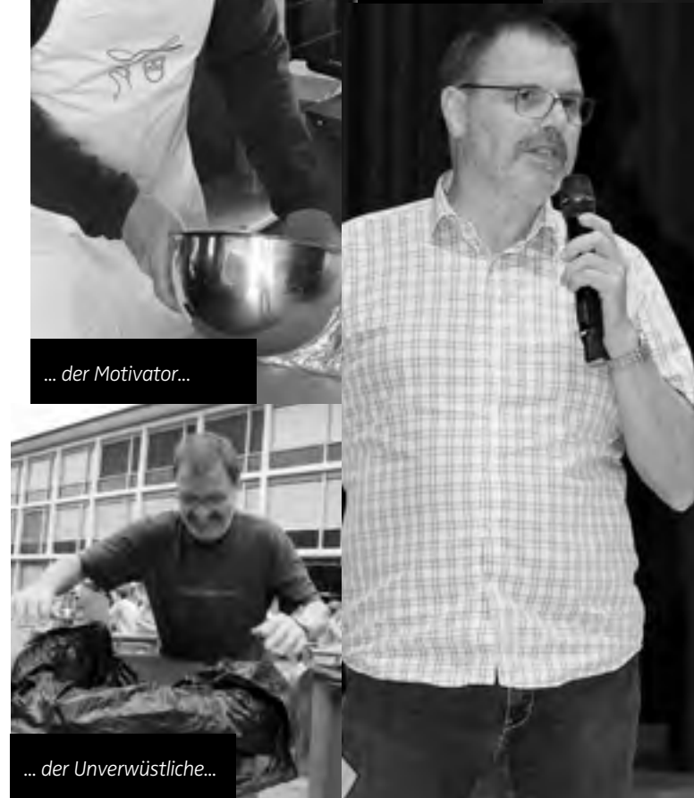
... der Unverwüstliche...