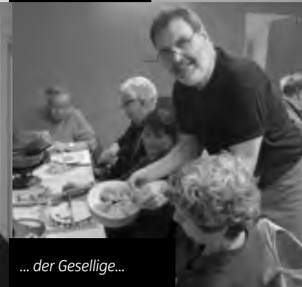
... der Gesellige...