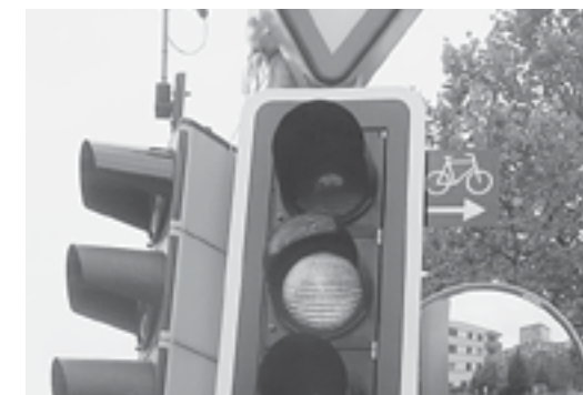
Neue Signalisation für Velo-Rechtsabbieger an der Kreuzung Göbli- Industriestrasse.

Am 1. Januar 2021 schuf der Bundesrat die rechtlichen Grundlagen für das Rechtsabbiegen bei Rot für Fahrräder, E-Trottinette, Mofas und schnelle E-Velos. Diese dürfen bei einem roten Lichtsignal rechts abbiegen, sofern an der Ampel rechts neben dem Rotlicht ein zusätzliches Schild mit einem gelben Velo auf schwarzem Grund angebracht ist. Dabei muss auf Fussgänger sowie den Querverkehr geachtet werden, denn diese haben weiterhin Vortritt. Wo das Schild fehlt, bleibt das Abbiegen nach rechts für Velofahrer weiterhin verboten.