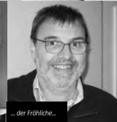
... der Fröhliche...