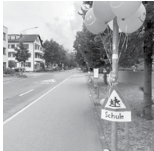
Befristete Ballon-Aktion besorgter Eltern zur Zeit der Tangenten-Eröffnung.

Zur Eröffnung der Tangente wurde durch eine private Aktion auf das Schulhaus aufmerksam gemacht. Besorgte Eltern haben entlang der Industriestrasse