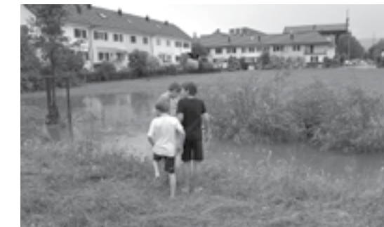
Wie werden sich der Quartierbach und die Wiese einst bei ähnlichem Hochwasser präsentieren, wenn dann alles überbaut ist? Wo staut sich das Wasser und reicht der Abfluss?

Auch das Guthirt-Quartier blieb nicht vom Hochwasser verschont. Im Juni und Juli gingen heftige Niederschläge teils mit Hagel nieder und innerhalb kürzester Zeit füllten sich Keller und der Quartierbach. Es sah zeitweise aus wie im Winter, man sah sogar Menschen mit Schneeschuhen den Hagel wegräumen. Dank nachbarschaftlicher Hilfe konnte an der Matten- und Bachstrasse dieses Mal schlimmeres verhindert werden. In anderen Gebieten im Quartier sah es wohl ähnlich aus.