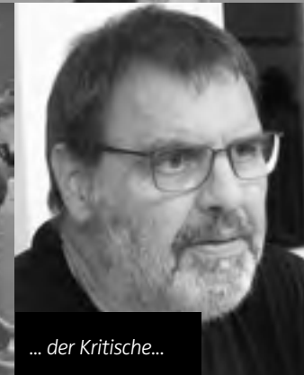
... der Kritische...